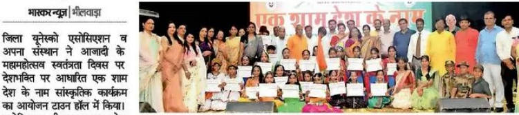
भिलावाड़ा. आजादी का महोत्सव कार्यक्रम में मौजूद बच्चे व अधिष्ठाता